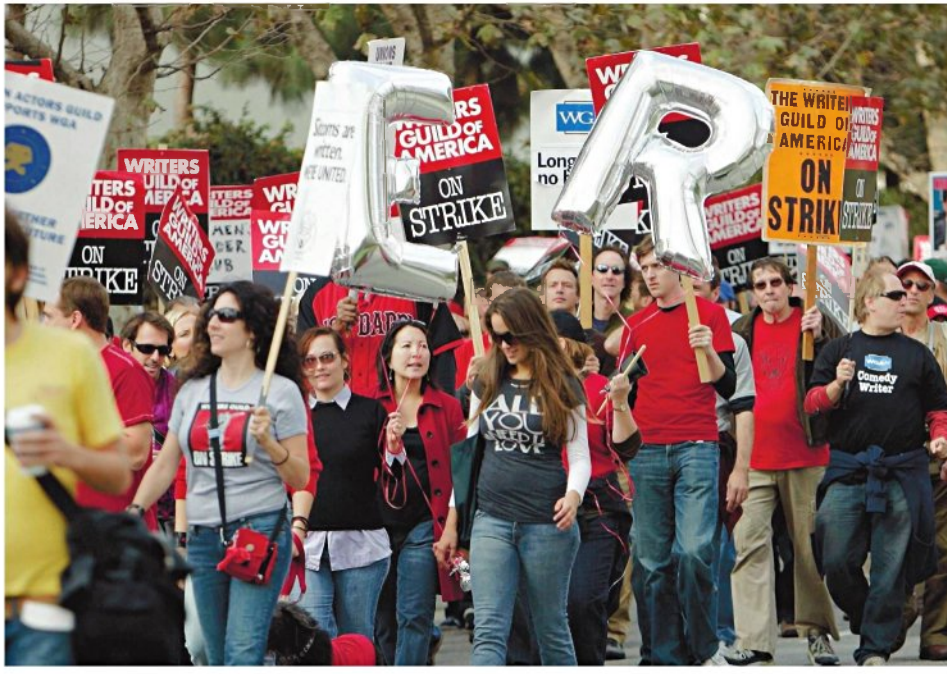
מחאת התסריטאים בהוליווד. הבינה המלאכותית בדרך להסכמי העבודה

כפועל, נראה שהתסריטאים יצאו למלחמה הירואית נגד מג-מה שהם לא הנפגעים העיק-יים ממנה. דווקא מקצועות כמו